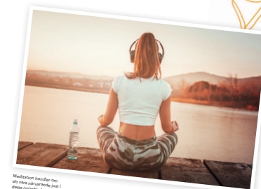
Meditation kan vara en bra hjälp för att minska din oro och öka självmedkänslan.

LIVSGLÄDJE Meditation bilen till hjälp för att minska din oro och öka självmedkänslan.